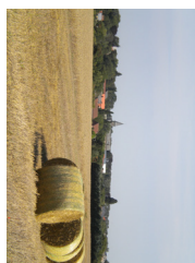
4 Vue sur Lincent