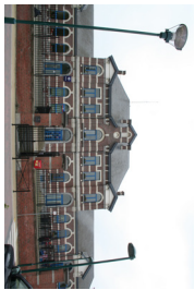
1 Administration communale de Lincent