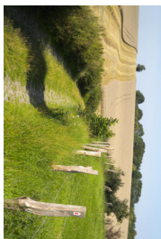
3 L'Havée Jacques