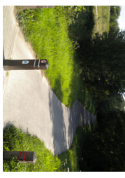
5 Le Ravel