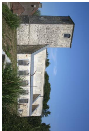
2 L'ancienne église Saint-Pierre