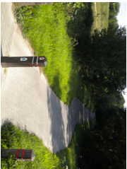
2 Le Ravel