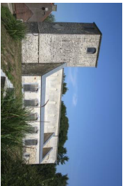
1 L'ancienne église Saint-Pierre