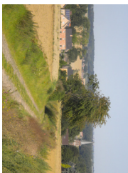
3 Vue sur Pellaines