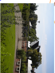
9 Aire de détente