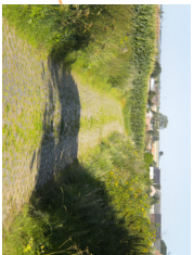
7 Vue sur Raccour