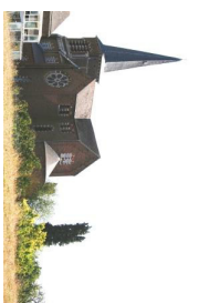
5 L'église Saint-Barthélemy