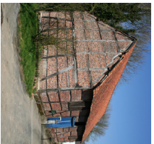
6 Le moulin de Pellaines