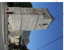
8 L'Église Saint-Christophe