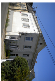
4 Le Château de Pellaines