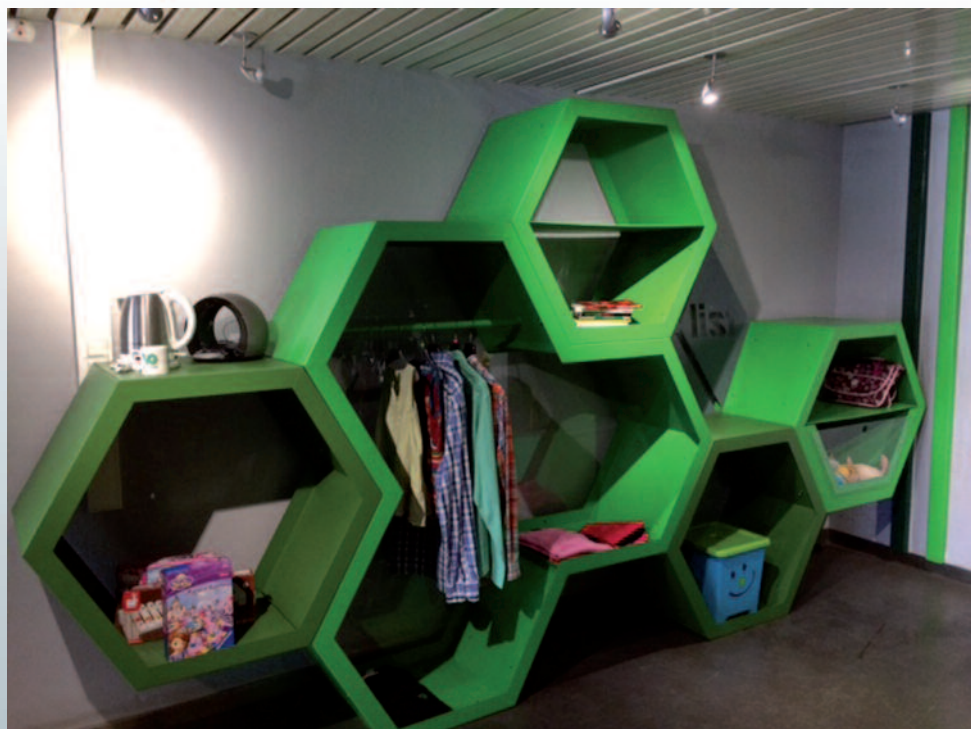
La « Give Box » ou « Boîte à Donner »

Bulletin communal TRIMESTRIEL DE LA COMMUNE DE LINCOURT