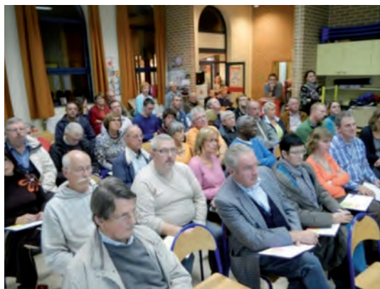
■ Info-consultation de Lincint