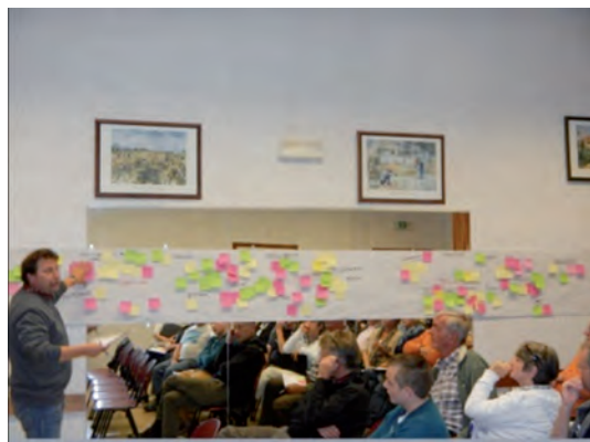
■ Info-consultation de Pellaines