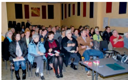
■ Info-consultation de Racour