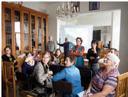
■ Info-consultation du personnel de l'administration et du CPAS de Lincint