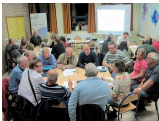
■ Info-consultation des associations